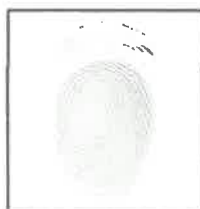
Huella dactilar CANDIDATO (Índice derecho)