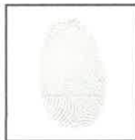
Huella dactilar CANDIDATO (Índice derecho)