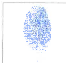
Huella dactilar CANDIDATO (índice derecho)