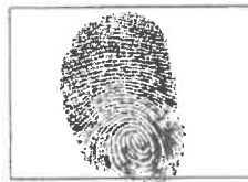
Huella Daclilar CANDIDATO (Indice derecho)