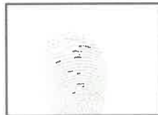
Huella dactilar CANDIDATO (Índice derecho)