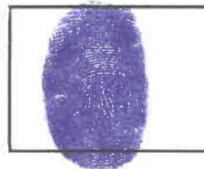
Huella dactilar CANDIDATO (Índice derecho)