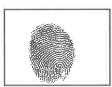
Huella dactilar CANDIDATO (índice derecho)