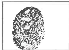
Huella dactilar CANDIDATO (Índice derecho)