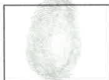
Huella dactilar CANDIDATO (Índice derecho)