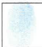
Huella Dactilar CANDIDATO (Índice derecho)