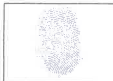
Huella Dactilar CANDIDATO (Índice derecho)