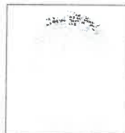
Huella Dactilar CANDIDATO (Índice derecho)