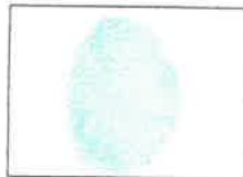
Huella Dactilar CANDIDATO (Índice derecho)