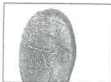
Huella Dactilar CANDIDATO (Índice derecho)