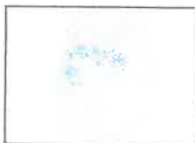
Huella Dactilar CANDIDATO (Índice derecho)