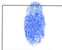
Huella Dactilar CANDIDATO (Índice derecho)