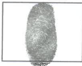
Huella Dactilar CANDIDATO (Índice derecho)