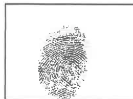
Huella Dactilar CANDIDATO (Índice derecho)