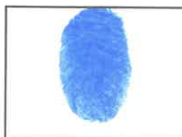
Huella Dactilar CANDIDATO (Índice derecho)