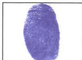
Huella Dactilar CANDIDATO (Índice derecho)