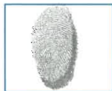
Huella dactilar (índice derecho)