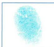
Huella dactilar (índice derecho)