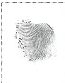
Huella dactilar (índice derecho)