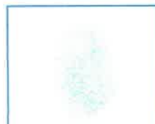
Huella dactilar (índice derecho)