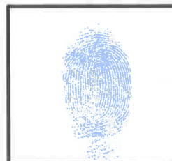
Huella Dactilar del Candidato (Índice derecho)