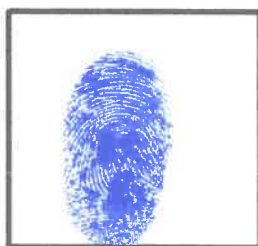
Huella Dactilar del Candidato (Índice derecho)