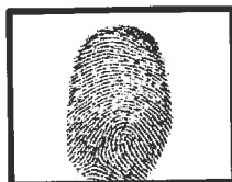
Huella Dactilar del Candidato (Índice derecho)