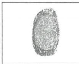
Huella dactilar CANDIDATO (índice derecho)