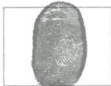
Huella Dactilar CANDIDATO